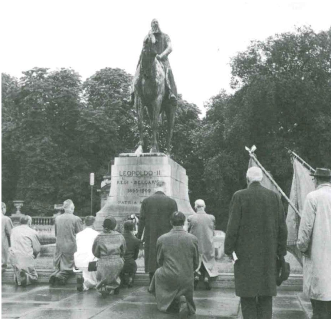
Source : Anne Cornet/Florence Gillet, Congo Belgique 1955 – 1965. Entre propagande et réalité , p.130