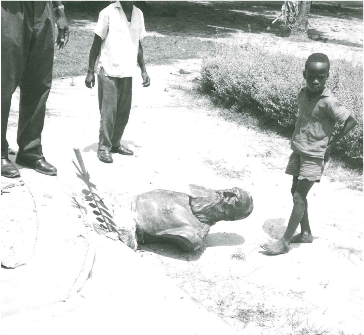
Source : Anne Cornet/Florence Gillet, Congo Belgique 1955 – 1965. Entre propagande et réalité , p.131