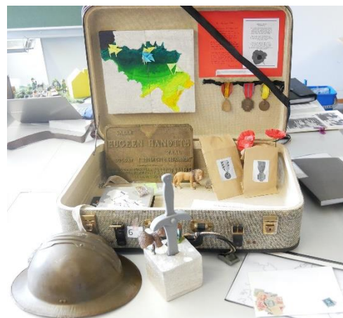
Valise Les vestiges de la Première et de la Seconde Guerre mondiale en Belgique

Que renferment ces vieilles valises ? Des objets ? Des lettres ? Des photos ? Quelles histoires racontent-ils ? Viens nous rejoindre pour une plongée dans l'histoire pendant et après les 2 guerres mondiales. Ensuite, choisis une thématique et imagine ta propre valise d'objets. À partir de 9 ans.