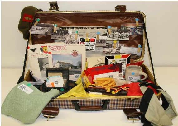
Koffer Het Dagelijkse leven van soldaten en hun families in de kazerne Kolonel SBH Adam in Soest

Om de tournee van de museumkoffers in België af te ronden, organiseert het War Heritage Institute / Koninklijk Legermuseum, in samenwerking met de Koninklijke Vereniging van de Vrienden van het Legermuseum, een "finissage".