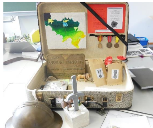
Koffer Resten van de Eerste en Tweede Wereldoorlog in België

Reservatie verplicht via de pedagogische dienst: 0032 (0)64 27 37 84 – sp@mariemont.be