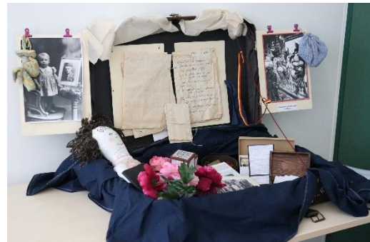
Van links naar rechts : Koffer Belgisch-Congo © foto BELZ / Koffer Intieme betrekkingen tussen Belgische vrouwen en Duitse soldaten tijdens de eerste en de Tweede Wereldoorlog © foto BELZ

De koffers stellen leerlingen van het lager en van het secundair onderwijs in staat de geschiedenis op een originele manier te ontdekken. In kleine groepjes kunnen ze de gekozen koffer uitpluizen; later, met de hele klas, nemen de leerlingen de plaats van de leerkrachten in om hun klasgenootjes over de geschiedenis te vertellen.