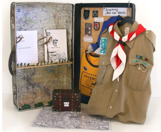
Koffer Kindertijd in Soest na de Tweede Wereldoorlog